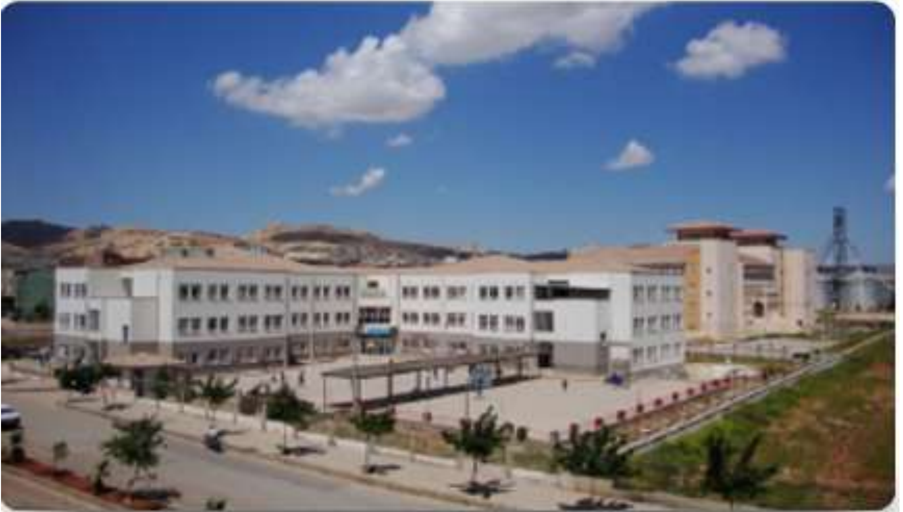
DR. CAVİT ÖZYEGİN İLKOKULU/ ORTAOKULU